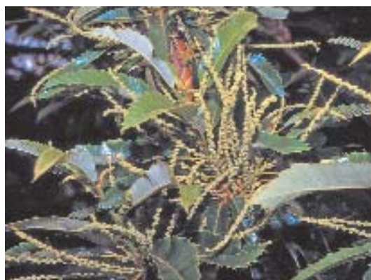
Fig. 29. Castanea sativa , flores masculinas.