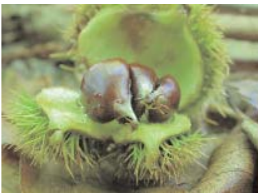
Fig. 30. Castanea sativa , frutos.