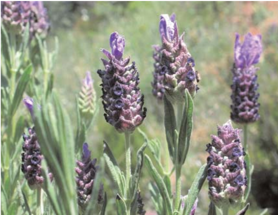
Fig. 48. Lavandula stoechas subsp. luisieri .

Los pastizales de efímeras, de escasa productividad por lo general, ocupan buena parte de la superficie de la dehesa. El majadal es considerado el pastizal por excelencia de la dehesa pastada por ovejas y constituye un modelo de las interacciones que se establecen entre planta-animal, dando como resultado un tapiz denso, muy productivo y con una importante participación de especies vivaces. Los vallicares ocupan zonas fértiles y con mayor humedad, presentando los valores más