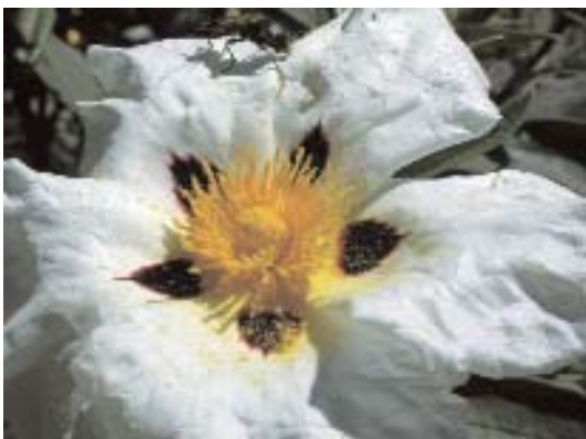
Fig. 45. Cistus ladanifer .

Aunque los jarales no se encuentran entre los tipos de hábitats naturales de la Directiva 92/43/CEE, sin embargo, debido al alto valor ecológico de estos hongos, algunos de los hábitats donde fructifican deberían ser protegidos, en vistas a la conservación de dichos hongos y a preservar los valores culturales asociados a su recolección y consumo.