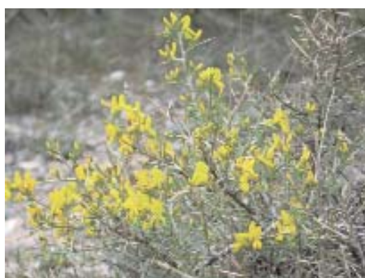
Fig. 35. Genista scorpius .

grande o medio, que representan un aspecto notable del paisaje salmantino al tratarse de tipos de vegetación ampliamente extendidos como etapas seriales de melojares y encinares.