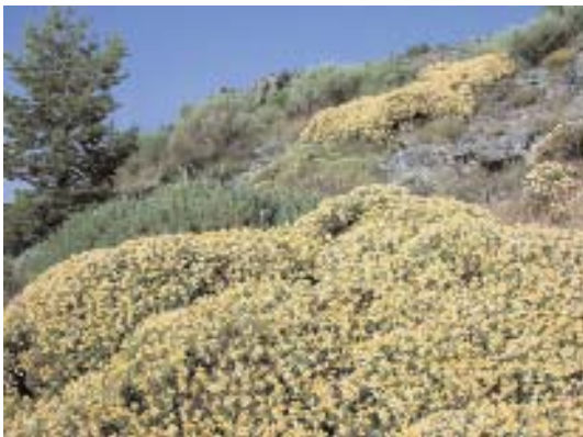
Fig. 36. Piornal con Echinopartum ibericum .