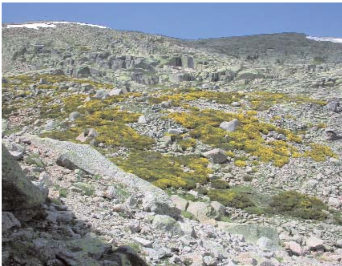
Fig. 10. Piornal de alta montaña.

sierra de Béjar, donde además de piornos y cambriones podemos encontrar con mayor frecuencia herbáceas como: Orobanche rapumgenistae , Festuca summilusitana , Deschampsia iberica , Cerastium ramosissimum , Rumex angiocarpus , Ornithogalum concinum , Reseda gredensis o Linaria elegans , entre otras.