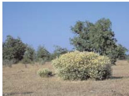
Fig. 21. Melojar con Echinospartum barnadesii .