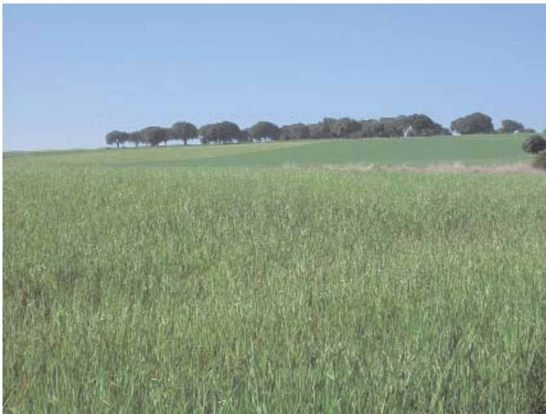
Fig. 22. Fragmento de encinar adhesado rodeado de cultivos de cereal.

Bajo precipitaciones entre 350 y 600 mm los bosques naturales corresponden a encinares, bosques esclerófilos mediterráneos en los que dominan las encinas o carrascas ( Quercus ilex subsp. ballota , Q. ilex subsp. rotundifolia ). Se trata de la formación vegetal más extensa en la provincia y ocupa una superficie de 49.218 ha; a esa extensión hay que añadir unas 130.000 ha de matorral, pastizal o cultivo con arbolado ralo de encinas. En definitiva, el encinar natural o seminatural y el adhesado representan más del 50% de la superficie arbolada de la provincia.