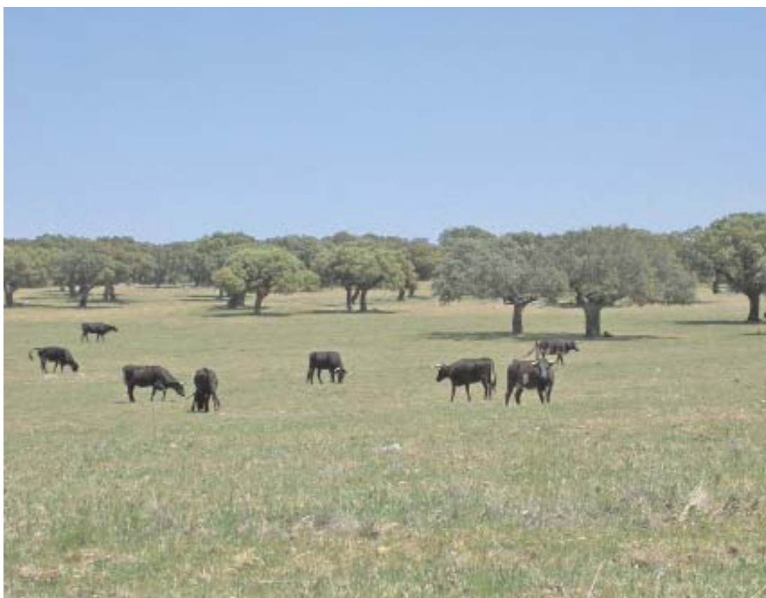
Fig. 50. Vallicares y majadales en la dehesa.

como leguminosas más frecuentes. Especialmente notable es la presencia del par Ornithopus compressus - Ornithopus perpusillus .