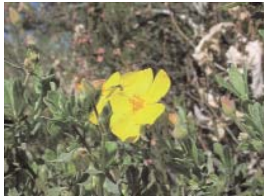
Fig. 41. Halimium alyssoides .