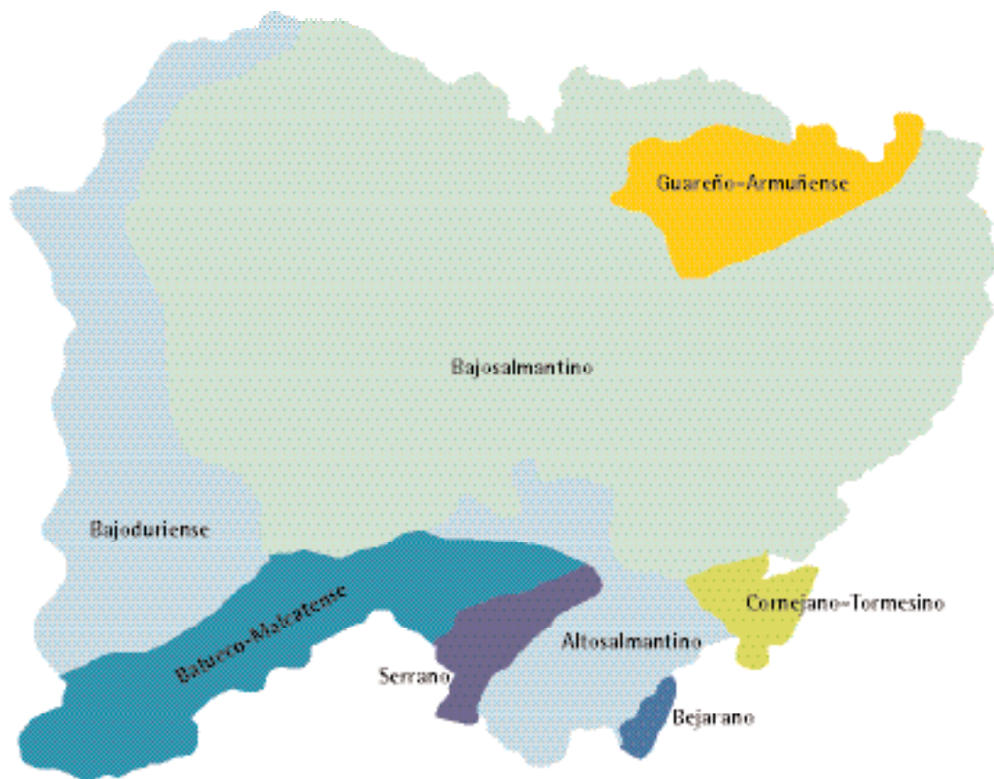
Fig. 7. Distritos biogeográficos presentes en la provincia de Salamanca (basado en RIVAS-MARTÍNEZ, 2004, inéd. , modificado).

de Valero, Sanchotello, Santibáñez de Béjar, Sorihuela, Valdefuentes de Sangusín, Valdehijaderos, Valdelacasa, Valdelageve, Vallejera de Riofrío, Valverde de Valdelacasa.