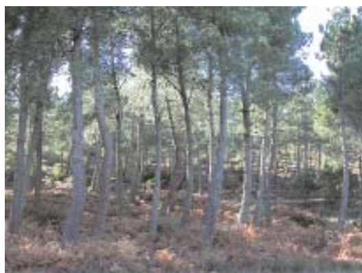
Fig. 33. El Maillo, pinar de Pinus pinaster .