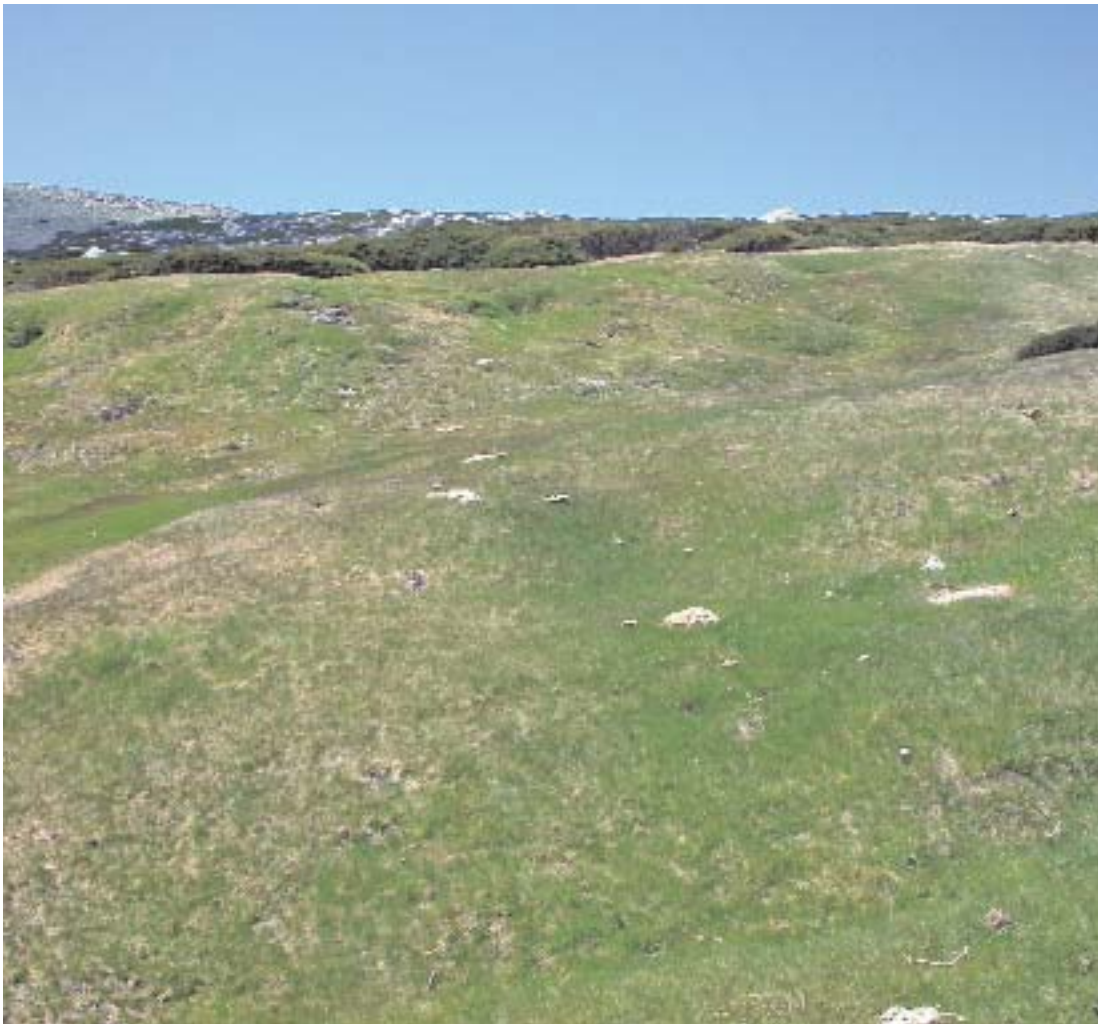
Fig. 15. Cervunal de Nardus stricta .

cervunales aparecen, a veces ocupando áreas notables, las turberas: suelos hidromorfos del orden de los histosoles formados por acumulación de materia orgánica (principalmente Sphagnum sp. pl.) y saturados de agua durante períodos prolongados (fig. 17).