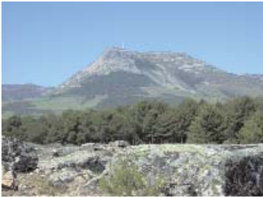
Fig. 5. Sierra de Francia.