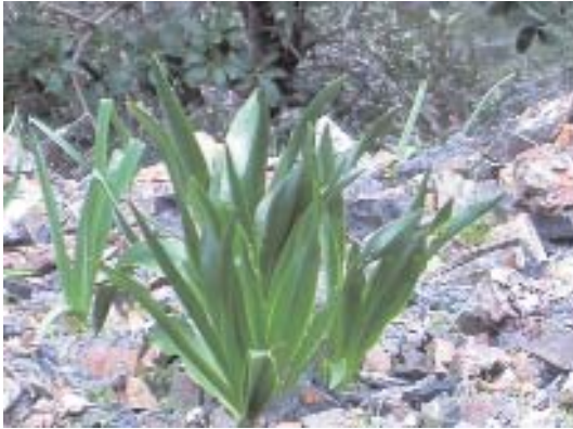
Fig. 47. Scilla maritima .