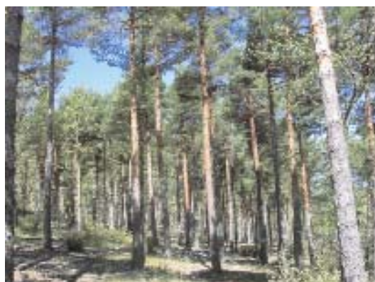
Fig. 32. La Alberca, pinar de Pinus sylvestris .