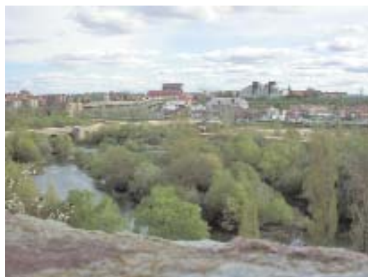
Fig. 27. Salamanca, vegetación de ribera junto al río Tormes.

Se presenta en los tramos medios e inferiores de ríos caudalosos de estiaje poco apreciable (fig. 27).