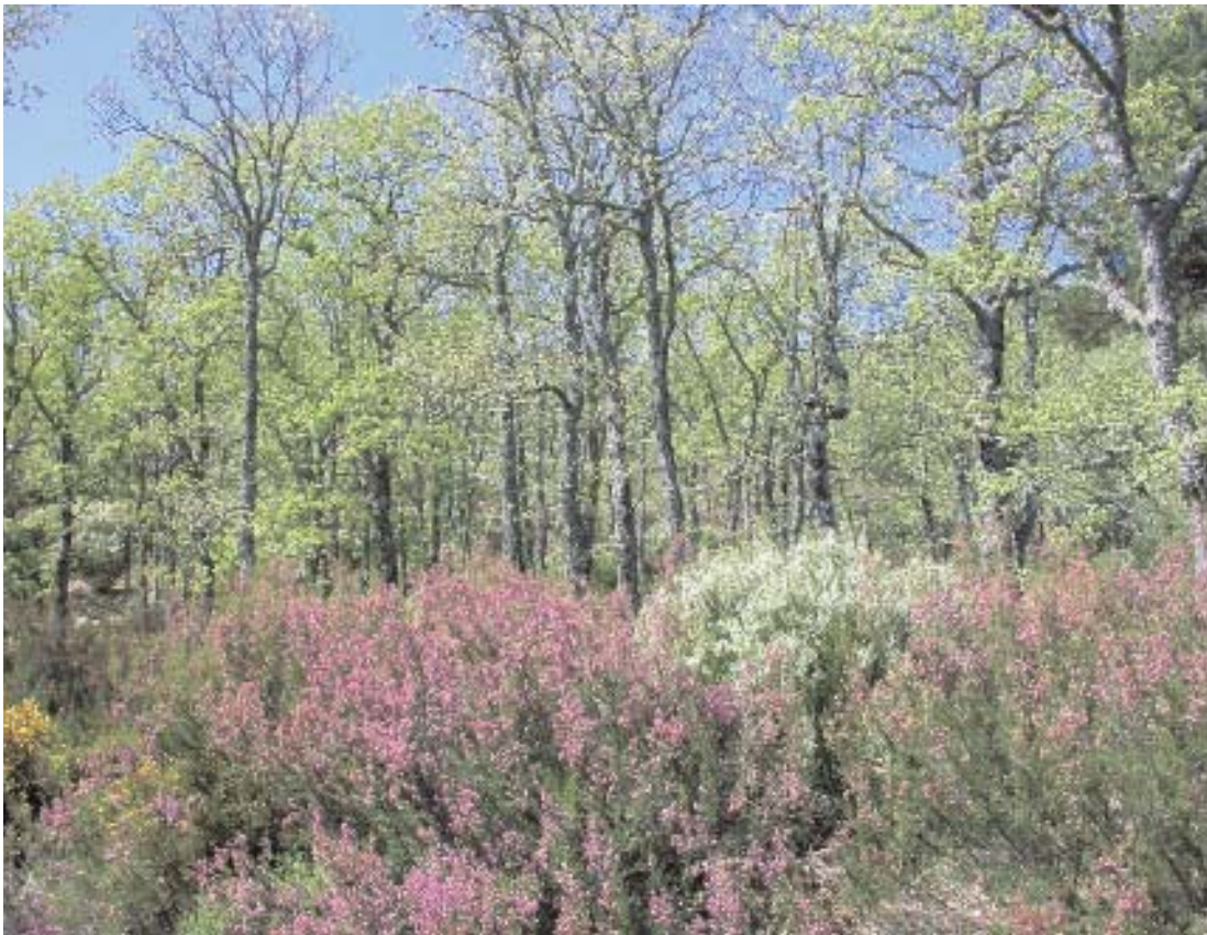
Fig. 42. Macrobrezal con carquejas, brezos rojos y brezos blancos en la orla del melojar.