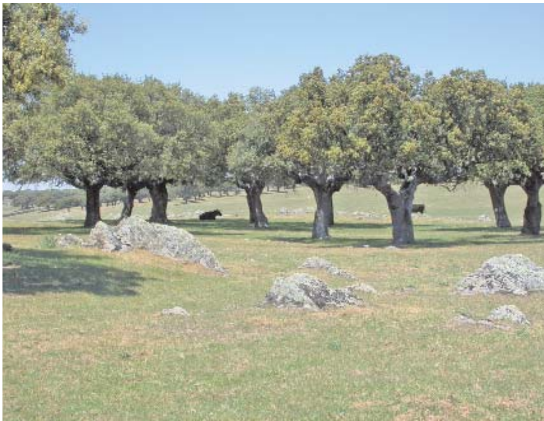
Fig. 4. Campo Charro.