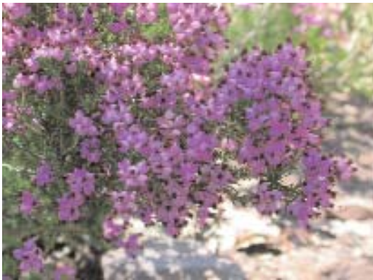
Fig. 40. Erica umbellata .

Finalmente, señalar los brezales higroturbosos propios de depresiones próximas a pequeños cursos de agua o áreas encharcables que llevan el brezo de turbera ( Erica tetralix ) y Genista anglica (fig. 44).