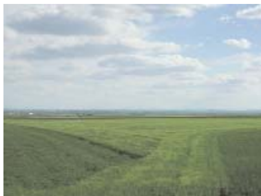
Fig. 3. La Armuña.