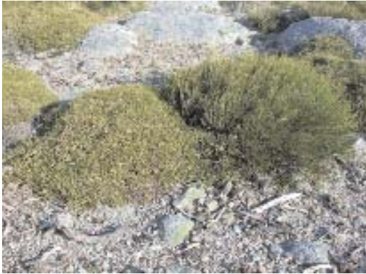
Fig. 13. Echinopartum ibericum subsp. pulviniformis (izquierda) y Cytisus oromediterraneus (derecha).