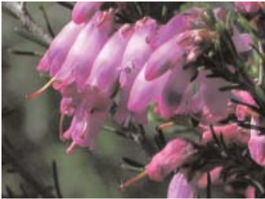
Fig. 43. Erica australis subsp. aragonensis .