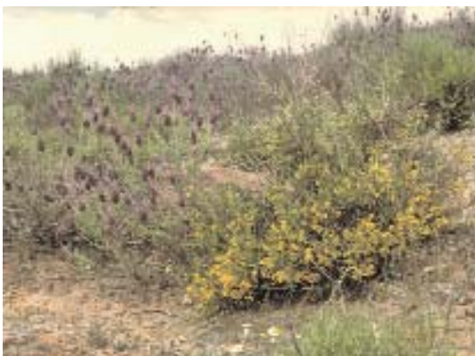
Fig. 38. Matorral de Lavandula stoechas subsp. pedunculata y Genista hystrix .

piornales dominados por la escoba blanca ( Cytisus multiflorus ) y el cantueso ( Lavandula stoechas subsp. pedunculata ) o aquellos en cuya composición interviene la aulaga espinosa Genista hystrix (fig. 38, 39), unas veces con cambriones ( Echinopartum ibericum ) y en otras ocasiones sin ellos pero con escoba blanca ( Cytisus multiflorus ) y retama negra ( Cytisus scoparius ).