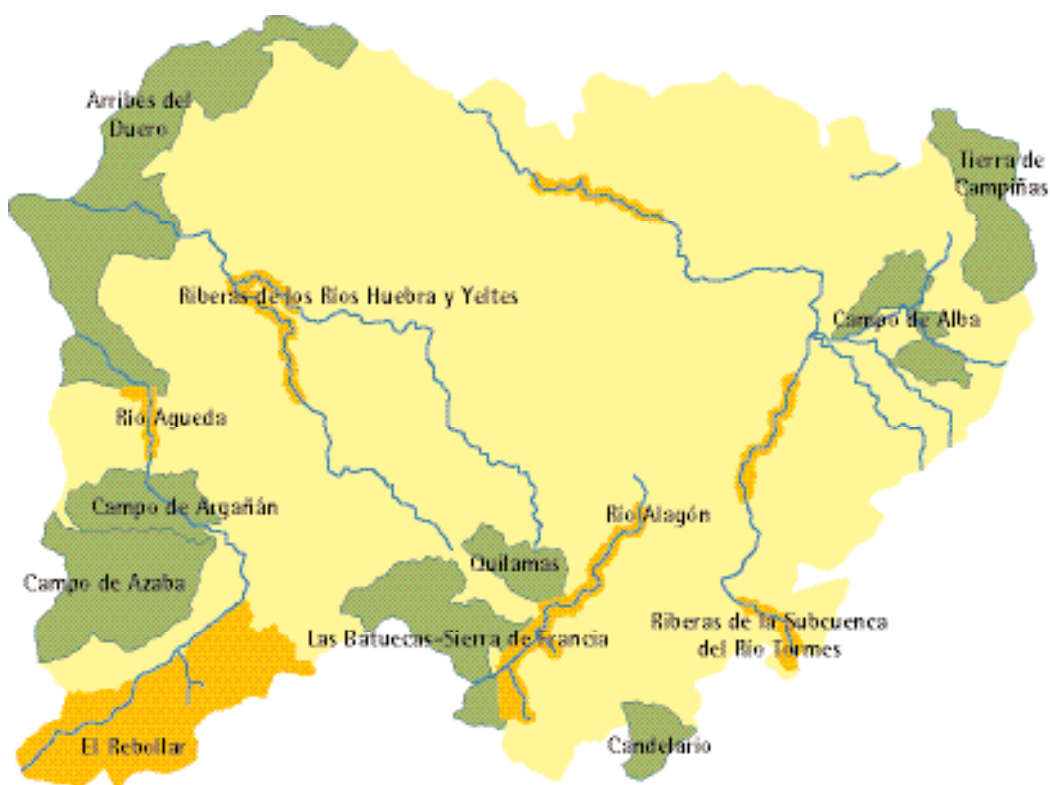
Fig. 8. La Red Natura 2000 en la provincia de Salamanca (Junta de Castilla y León. Octubre 2003)

En este sentido es de destacar que el catálogo de comunidades vegetales naturales o seminaturales (hábitats) que se ha elaborado en los países de la Unión Europea a partir de 1992, como consecuencia de la promulgación de las Directivas 92/43/CEE y 97/62/CE, constituye una de las bases fundamentales para el establecimiento de la Red Natura 2000 (fig. 11), futura estructura europea de espacios naturales protegidos, que estará formada por dos tipos de terrenos: ZECs (Zonas especiales de conservación), designadas a partir de la Directiva 92/43/CE y ZEPAs (Zonas especiales de protección para las aves), designadas conforme a la Directiva 79/409/CEE sobre protección de aves silvestres.