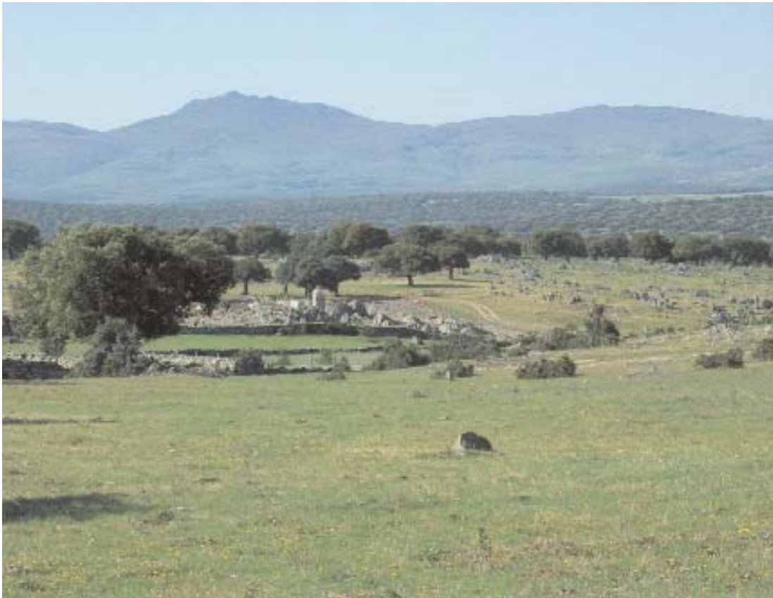
Fig. 23. Encinar adehesado.

La extensión de la agricultura (fig. 22), aprovechamiento maderero, incendios, ... ha provocado la desaparición de muchos encinares, de manera que hoy sólo se conservan núcleos bien estructurados en algunos territorios poco poblados, de quebrado relieve o de vocación ganadera o cinegética; muchos campos de cereales se asientan sobre el suelo que antaño sustentó grandes encinares.