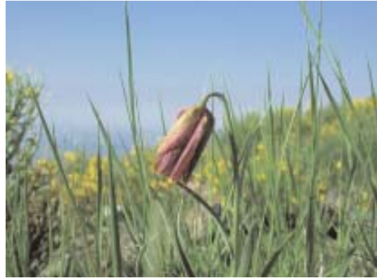
Fig. 14. Fritillaria nervosa subsp. falcata .

Es notable la gran extensión que en este nivel alcanzan los prados higrófilos de Nardus stricta (cervunales) -fig. 15 y 16- con Poa legionensis , Luzula carpetana o Juncus squarrosus , que constituyen el sostén de una parte de la cabaña bovina regional. Junto a estos