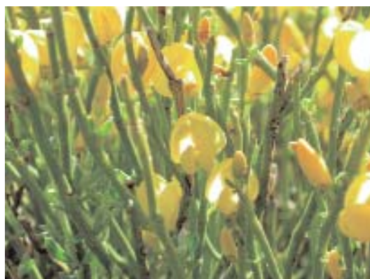
Fig. 12. Cytisus oromediterraneus (detalle de ramas y flores).