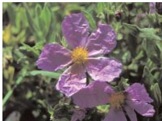
Fig. 46. Cistus albidus .