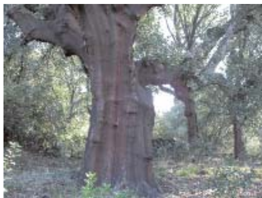
Fig. 25. Quercus suber .

En el valle del río Alagón junto al alcornoque aparecen madroños ( Arbutus unedo ), jara cervuna ( Cistus populifolius ) y, como elemento diferenciador, Sanguisorba hybrida ; ocasionalmente, en las umbrías, penetra el quejigo de Brotero ( Quercus faginea subsp. broteroi ). Estos alcornocales logran su óptimo en el suroccidente peninsular ya que requieren un clima templado, sin