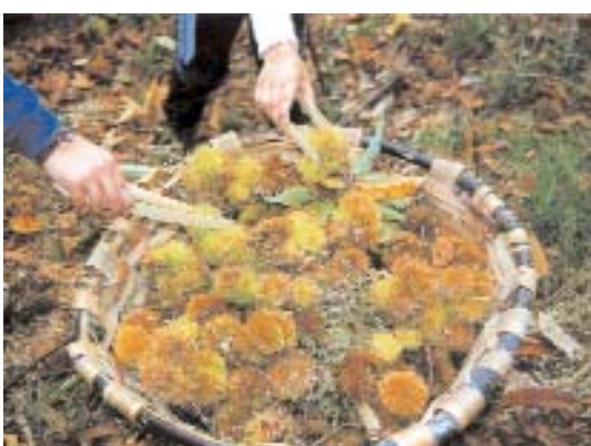
Fig. 31. Cestería del castaño y recolección de erizos.

Por otra parte, en Salamanca, y según datos del Ministerio de Agricultura, Pesca y Alimentación (MAPYA) para el año 2001, la corta de madera de castaño alcanzó la cifra de 3.780 m 3 con corteza, la más elevada de Castilla y León, pero muy lejos de los 11.706 m 3 con corteza de la vecina provincia de Cáceres.