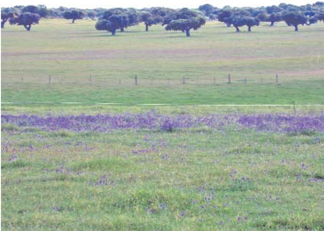
Fig. 49. Vallicares y majadales en la dehesa.

altos de producción; el gradiente de humedad y la fertilidad del suelo hacen que puedan diferenciarse vallicares pobres, vallicares normales y vallicares húmedos. Los bonales representan un caso extremo de vallicares sometidos a encharcamiento temporal.