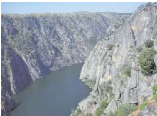
Fig. 2. Las Arribes.

Con un criterio sintético, vamos a considerar las siguientes comarcas (fig. 1): Las Arribes (fig. 2), Campo de Vitigudino, Campo de Ledesma, La Armuña (fig. 3), Campo de Peñaranda, Campo de Alba, Campo Charro (fig. 4), Campo de Yeltes, El Abadengo, Campo de Argañán, Campo de Azaba, El Rebollar, Sierra de Gata, Sierra de Francia (fig. 5) y Sierra de Béjar (fig. 6).