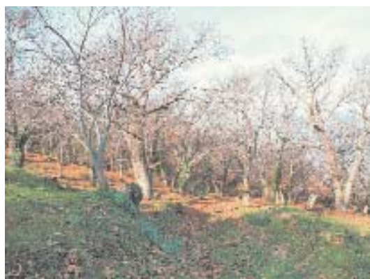
Fig. 28. Castañar.

Todo ello convierte a esta localidad del CW ibérico en un área de elevado interés para su conservación.