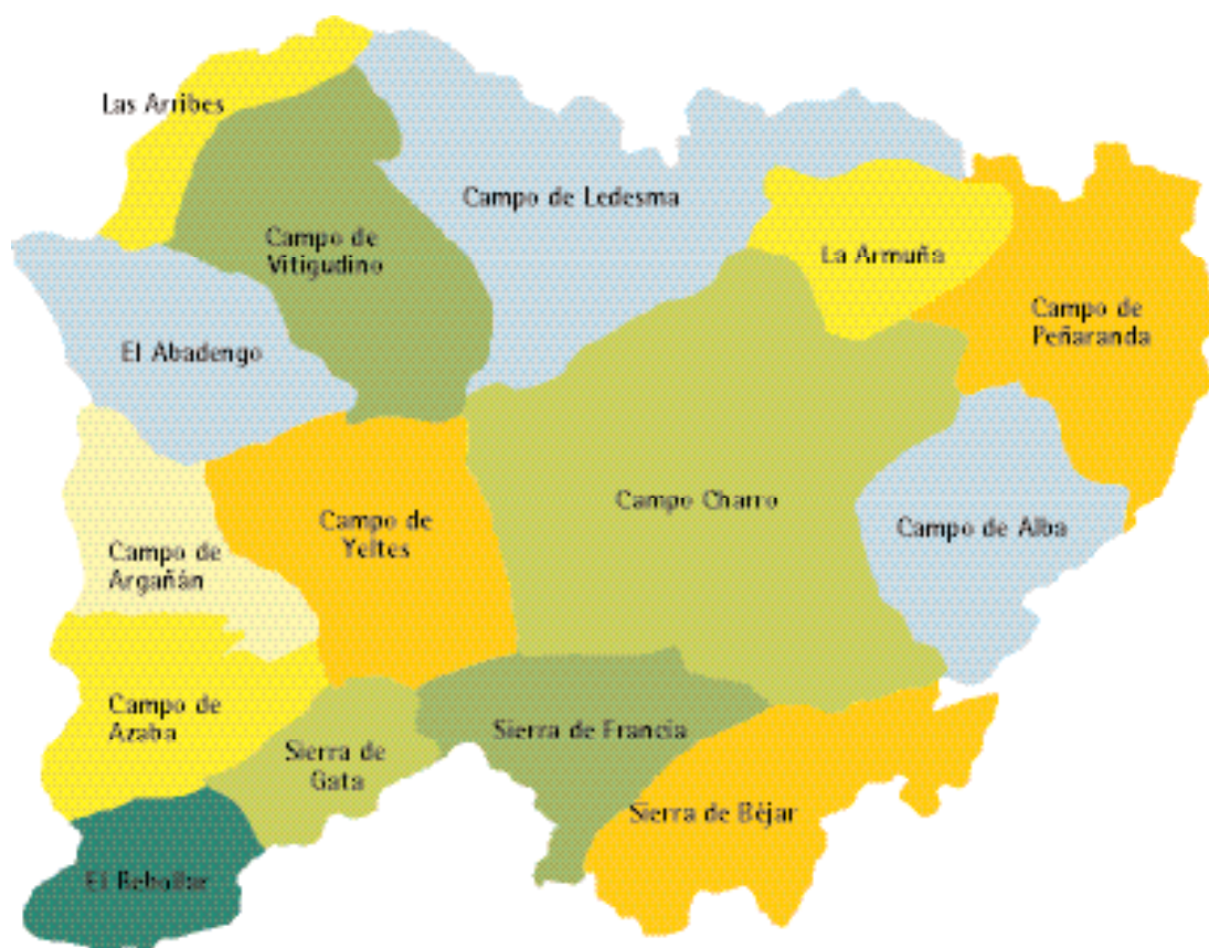
Fig. 1. Mapa general de las comarcas de la provincia de Salamanca consideradas en este trabajo.

Llanuras terciarias, penillanuras paleozoicas, arribes y La Sierra son los cuatro sectores que geógrafos y geólogos han considerado diferentes en la provincia de Salamanca.