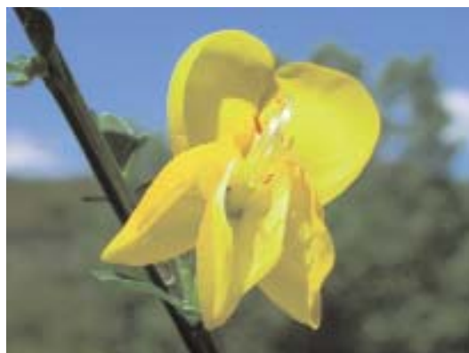
Fig. 34. Cytisus scoparius .

Bajo la denominación de piornales, escobales o escobales se incluyen las formaciones de diversas especies de Genista y Cytisus , de tamaño