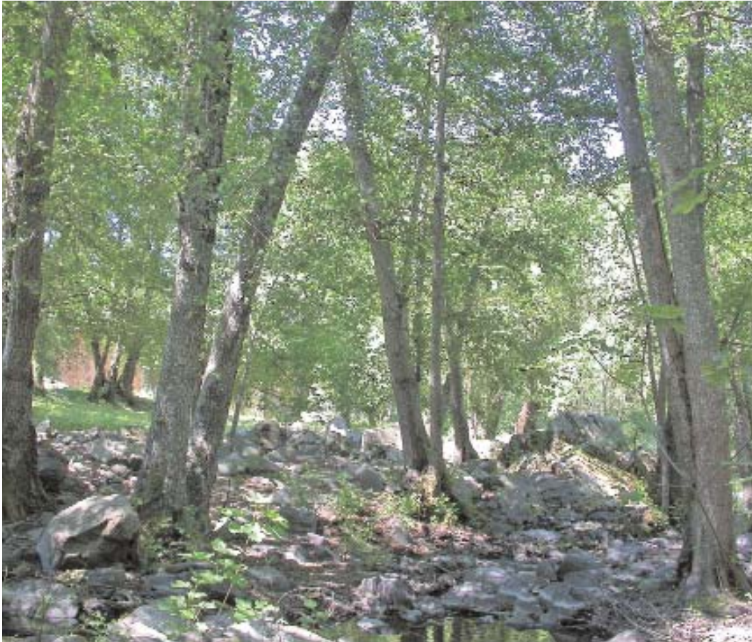
Fig. 26. Aliseda en el río Alagón.

Pueden diferenciarse dos tipos de alisedas dependiendo del nivel altitudinal y como consecuencia del tipo de clima y la composición florística. Las que aparecen en altitudes inferiores de los ríos Tormes, Agueda o Alagón, llevan el helecho real ( Osmunda regalis ), clemátides ( Clematis campaniflora ), escrofularias ( Scrophularia scorodonia ). Las de cabeceras de los ríos y arroyos serranos unen a la ausencia de las plantas termófilas la presencia de elementos como el endemismo ibérico Galium broterianum , ocasionalmente Paradisea lusitanica , abedules ( Betula celtiberica ) y acebos ( Ilex aquifolium ), preferentemente.