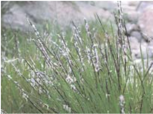
Fig. 16. Nardus stricta .