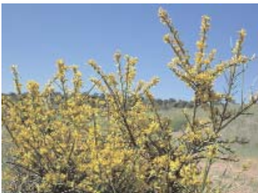
Fig. 39. Genista hystrix .