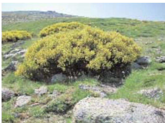
Fig. 11. Cytisus oromediterraneus .