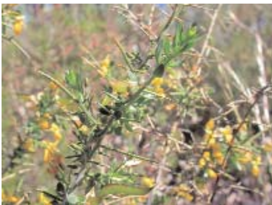
Fig. 20. Genista falcata .

A pesar de que el melojo es la especie de más amplia distribución en la península Ibérica, son escasos los lugares donde se han conservado buenos bosques de la misma. Uno de los pocos lugares donde aún existen rebollares de cierta importancia es en la comarca de El Rebollar.