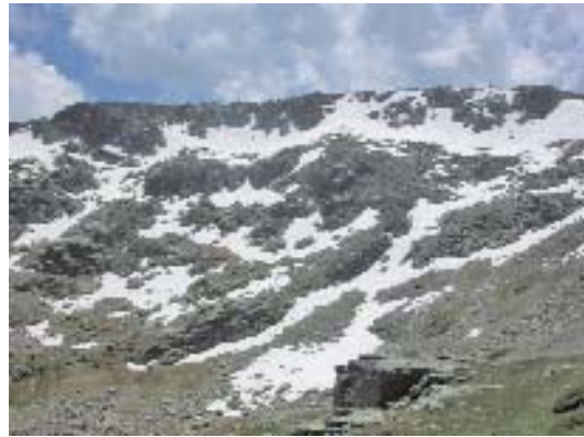
Fig. 6. Sierra de Béjar.

De especial importancia, en relación con la identificación de las principales comarcas productoras de especies micológicas de interés comercial, resulta la franja sur provincial, es