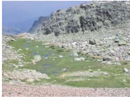
Fig. 17. Cervunales y formaciones higroturbosas.