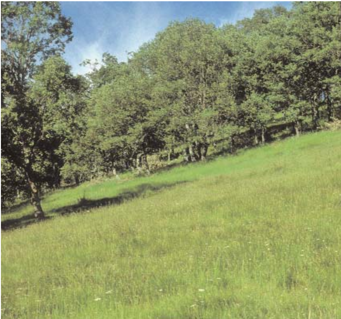
Fig. 18. Melojar con sotobosque de Festuca elegans .

m, bajo ombroclima al menos subhúmedo ( P > 600 mm) y alcanzan una extensión de 39.011 ha, a la que hay que añadir una buena parte de las más de 64.000 ha que el Segundo Inventario Forestal Nacional adjudica a las formaciones adehesadas de melojos, quejigos o mezclas de ambas especies con encinas.