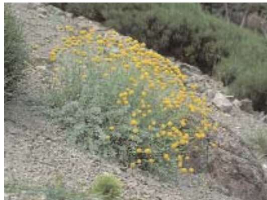
Fig. 37. Candelario, Santolina oblongifolia .

piornales dominados por la escoba blanca ( Cytisus multiflorus ) y el cantueso ( Lavandula stoechas subsp. pedunculata ) o aquellos en cuya composición interviene la aulaga espinosa Genista hystrix (fig. 38, 39), unas veces con cambriones ( Echinopartum ibericum ) y en otras ocasiones sin ellos pero con escoba blanca ( Cytisus multiflorus ) y retama negra ( Cytisus scoparius ).