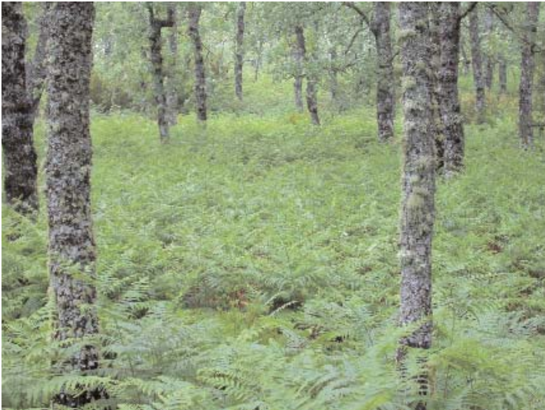
Fig. 19. Melojar con sotobosque de Pteridium aquilinum .

En la Sierra de Béjar aparecen melojares continentales -fig. 18- con Luzula forsteri y Festuca elegans logrando un gran desarrollo los escobales y piornales de sustitución a base de Genista florida , Cytisus scoparius , Adenocarpus hispanicus , Cytisus oromediterraneus y Genista cinerea subsp. cinerascens .