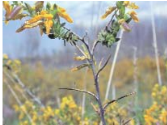
Fig. 44. Genista anglica .