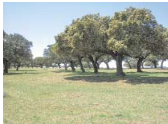
Fig. 24. Encinar adehesado.

Los encinares de Salamanca se presentan principalmente bajo la forma de carrascales abiertos, silicícolas, con Genista hystrix , frecuentemente adehesados (fig. 23 y 24) y a veces con "quejigos" ( Quercus faginea subsp. faginea ) -Campo Charro, Valdelosa- o enriquecidos en Juniperus oxycedrus -Arribes del Duero-.